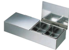
③ EBM 18-8 ダブルカバー式 ヤクミ入