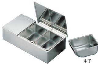
② EBM 18-8 セパレートカバー式 ヤクミ入