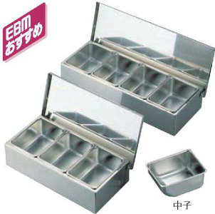
① EBM 18-8 オープン式 ヤクミ入

EBMオープン式、セパレートカバー式、ダブルカバー式の各ヤクミ入の蓋は、すべて蝶番式になっており使用時の蓋の紛失や置場所に困りません。