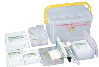
⑫密封式 検食袋 基本セット