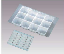
②使い捨て 検食容器 トレーセット 12穴 (100枚入)