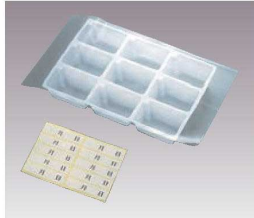
①使い捨て 検食容器 トレーセット 9穴 (100枚入)

使い捨てトレーですから洗う手間が省け、「一般ゴミ」として処理でき、中身がよく見えるので検食の習慣が容易に付きます。