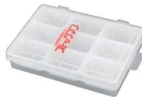
③PP 使い捨て用 検食容器 ストッカー