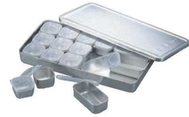
⑥MA 18-8 検食容器 (中子PP蓋付)