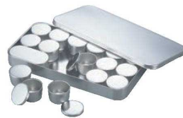
⑤SW 18-8 検食容器 (中子蓋付)