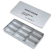
④アルマイト 検食容器 (角型)