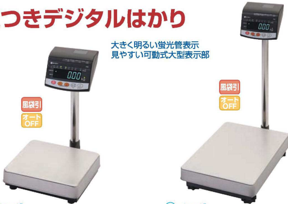
①イシダ 電子質量台はかり