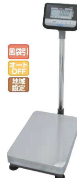
⑤ヤマト デジタル台はかり