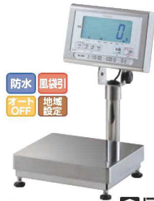
③クボタ デジタル台はかり (検定付)