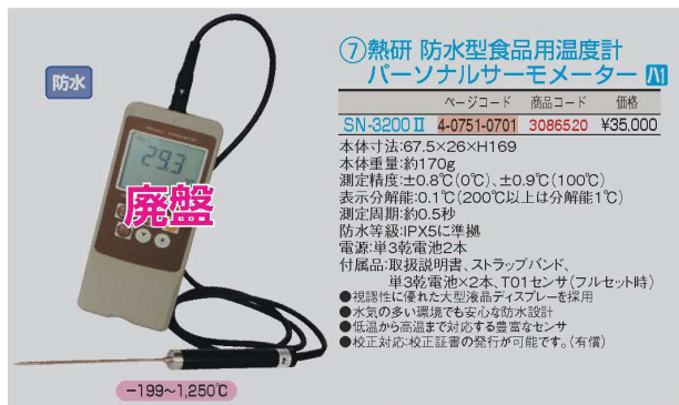
⑦ 熱研 防水型食品用温度計 パーソナルサーモメーター 防水