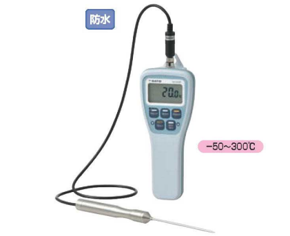
① SATO 防水型デジタル温度計 SK-270WP (標準センサー付) 防水