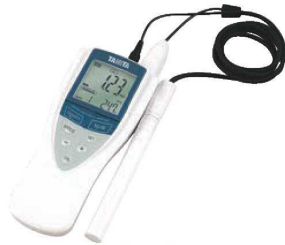
②タニタ 残留塩素計セット