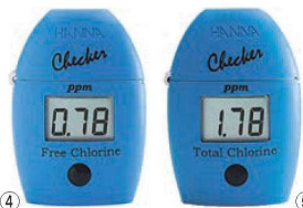
④ハンナ デジタル残留塩素計