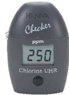
⑥ハンナ 超高濃度 残留塩素計Checker HC