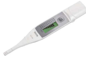
③タニタ 残留塩素チェッカー