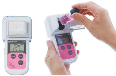
①ハンディ水質計 アクアブ 残留塩素 AQ-201 ページコード 商品コード 価格 080560-201 4-0782-0101 5761100 ¥50,000