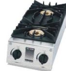
③シルクレーン ガステーブル スペースガッツ SK-5

外寸:738×275×H118 重量:8.9kg 材質:ステンレス、鋳物、樹脂 ●コンパウト設計 ●設置場所の限られた厨房に最適