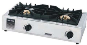
①シルクレーン ガステーブル ガッツNo2 SK-2