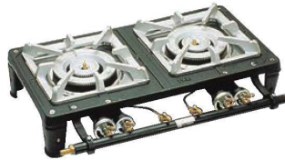
⑤ガステーブルコンロ MD-702 (2連)