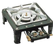
④ガステーブルコンロ MD-701 (1連)