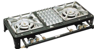
⑥ガステーブルコンロ MD-702L (2連大)