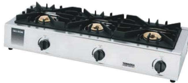
②シルクレーン ガステーブル ガッツNo3 SK-3

外寸:542×275×H118 重量:6.5kg 材質:ステンレス、鋳物、樹脂 ●コンパウト設計 ●設置場所の限られた厨房に最適