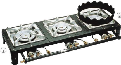
⑦ガステーブルコンロ MD-703 (3連)