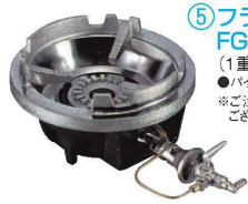
⑤フラッシュ ガスコンロ FG-2型 (1重バーナー、立型ゴク) ●パイロット(種火付) ※ご注文の際は、平型と立型のゴクが ございますのでご指定ください。