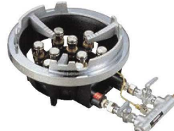
③ジャンボ ガスコンロ TG型 ●パイロット(種火付) ※立型ゴクのみのご指定です。 ※TG-15Jは特立ゴクのみになります。 (⑩のゴク参照)