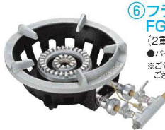
⑥フラッシュ ガスコンロ FG-3型 (2重バーナー、平型ゴク) ●パイロット(種火付) ※ご注文の際は、平型と立型のゴクが ございますのでご指定ください。