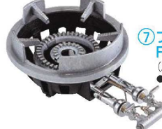
⑦フラッシュ ガスコンロ FG-4型 (2重バーナー) 特立ゴク専用 ●パイロット(種火付)