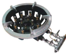
②ガスコンロ TG型 ●パイロット(種火付) ※ご注文の際は、平型と立型のゴクが ございますのでご指定ください。