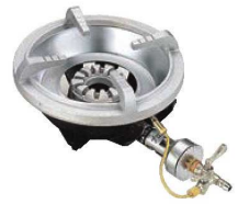
④フラッシュ ガスコンロ FG-1型 (1重バーナー、平型ゴク) ●パイロット(種火付) ※平型ゴクのみのご指定です。