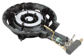
①ガスコンロ SG-2型 (2重バーナー) ●パイロット(種火付)