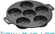
④アサヒ 鉄イモノ 巴焼器 A815-17 切