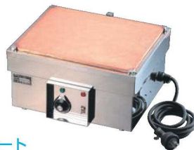
⑦電気ホットプレート