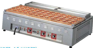
⑤電気 大判焼器 (今川焼器)