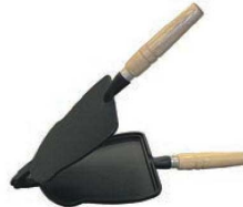
③鉄 いか焼器 切