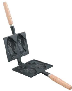
①鉄 たい焼器 418 切