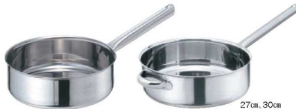
②EBM モリブデンII 浅型 片手鍋 蓋無