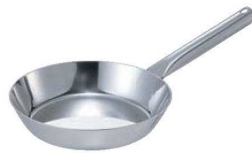
④EBM モリブデンII フライパン