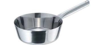
③EBM モリブデンII テーパーパン