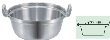
⑤EBM モリブデンII 料理鍋