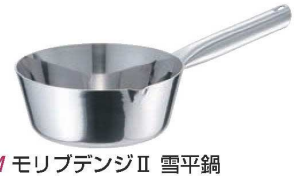
⑥EBM モリブデンII 雪平鍋