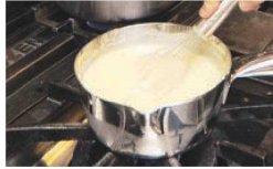
ミラー加工により 耐腐食性をさらにUP