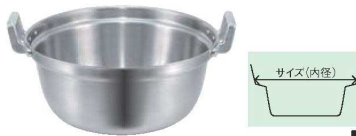
⑤EBM モリブデンII 料理鍋