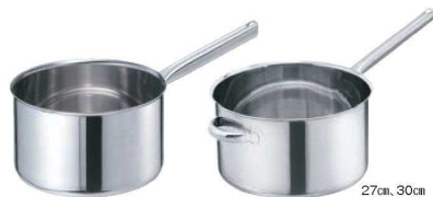
①EBM モリブデンII 深型 片手鍋 蓋無