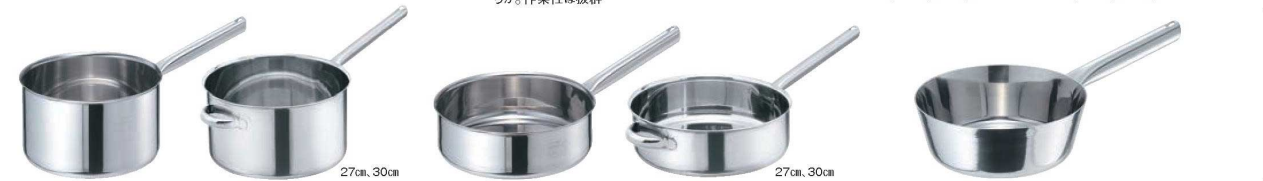
①EBM モリブデンII 深型 片手鍋 蓋無