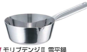
⑥EBM モリブデンII 雪平鍋