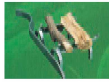
図のように使用するとより効果的です。