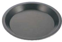
①EBM アルミスーパーコートパイ皿