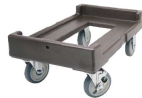
⑮ピザ生地ボックス用 カムドリー CD1826PDB