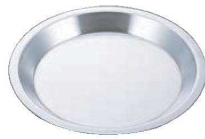
②EBM アルミ パイ皿