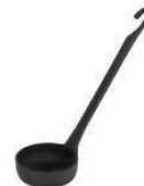
⑨パデルノ ピザレードル 150cc 12968-10