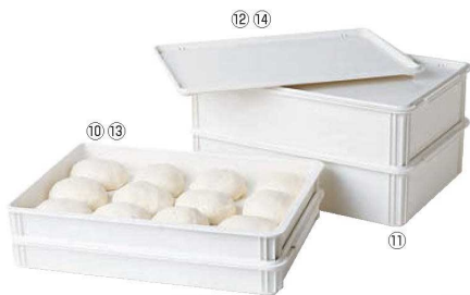
⑩ピザ生地ボックス 浅型 DB18263CW