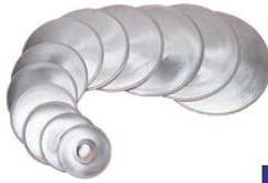
⑤マトファー ボール・オ・パン 12枚セット 82651