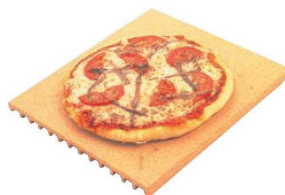
⑥デロンギ ピザストーン PS-CN