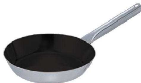
④EBM モリブデンⅡ プラス フライパン