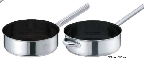
②EBM モリブデンⅡ プラス 浅型 片手鍋 蓋無