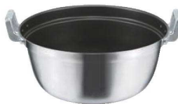
⑤EBM モリブデンⅡ プラス 料理鍋