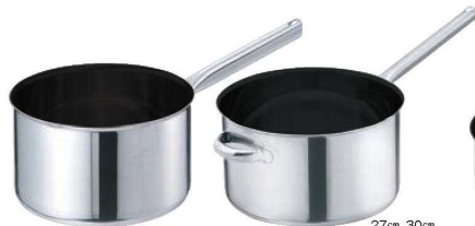
①EBM モリブデンⅡ プラス 深型 片手鍋 蓋無

修理不可な鍋・フライパン ● PC柄または木柄のフライパン ● ヘコミの酷い鍋・フライパン