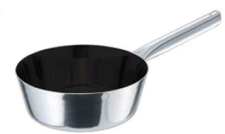
③EBM モリブデンⅡ プラス テーパーパーン