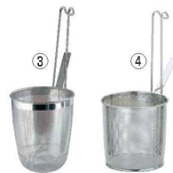
③UK 18-8 パンチング 共柄 丸底 テボ