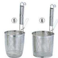
⑤UK 18-8 パンチング パイプ柄 丸底 うどんテボ