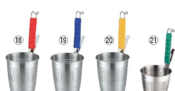
UK 18-8 シリコン柄 カラーハンドルてぼ