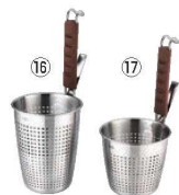
UK 18-8 シリコン柄 プレスパンチング てぼ