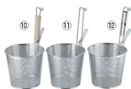
UK 18-8 パンチング 平底うどん揚