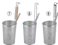
UK 18-8 パンチング 深型 底平煮ざる