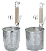
①UK 18-8 パンチング 木柄 丸底 うどんテボ