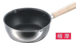
⑧EBM プロシェフ 2PLY プラス IH 雪平鍋 (目盛付)