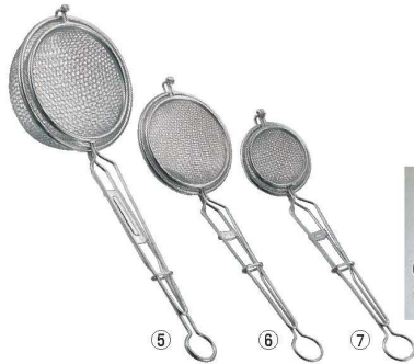
MI 18-8 パーズネストフライヤー