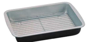
⑪ブラックフィギュア 天ぷらバット D-049