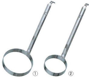
18-8 共柄 カキ揚げリング