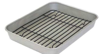
⑬フッ素天ぷらバット