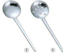
T 18-0 共柄 カキ揚お玉