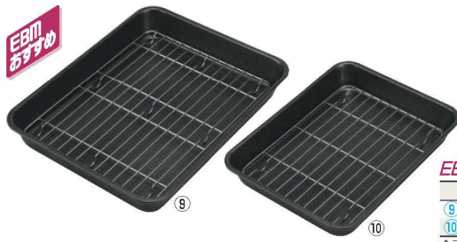
EBM 18-8 天ぷらバット