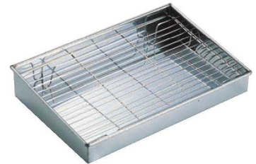
⑧EBM 18-0 角天台