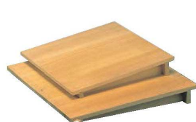
⑧EBM さわら 角セイロ傾斜蓋