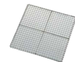
⑤EBM 18-8 クリンプ目 角セイロアミ