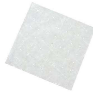
⑪穴明セパレートペーパー (1,000枚入)

●蒸気もれを防ぐ ●すべり止めになる ●セイロに熱を伝えにくくなる ※セイロ昇降機の下に敷いてお使いください。