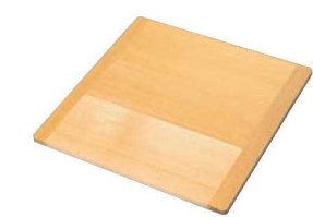
⑥EBM さわら 角セイロ蓋