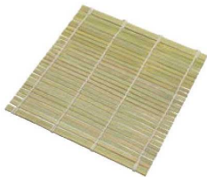
③EBM 竹 角セイロ用すだれ