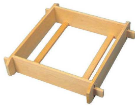
①EBM さわら 角セイロ (身) 深口