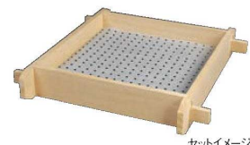
⑫リンベシート角型 (メッシュペーパー) (250枚入)

材質:グラシン紙にシリコン特殊コーティング 穴径:2mm ●蒸し時間が短縮でき、蒸しムラが少ない ●鍍金の底がベタつきにくい