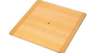
⑨EBM さわら 角セイロ台す