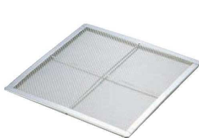
④EBM 18-8 角セイロアミ