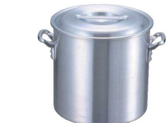
①EBM アルミ プロシェフ IH 寸胴鍋 (目盛付)