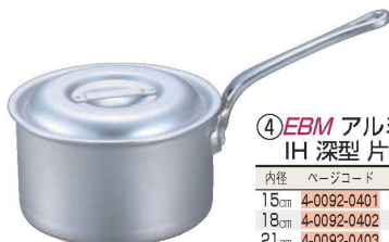
④EBM アルミ プロシェフ IH 深型片手鍋 (目盛付)