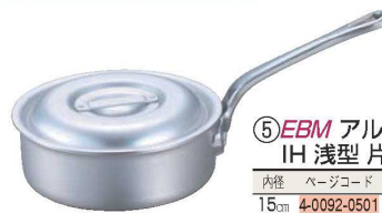
⑤EBM アルミ プロシェフ IH 浅型片手鍋 (目盛付)