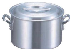
②EBM アルミ プロシェフ IH 半寸胴鍋 (目盛付)