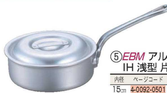
⑤EBM アルミ プロシェフ IH 浅型片手鍋 (目盛付)