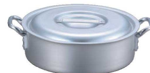
③EBM アルミ プロシェフ IH 外輪鍋