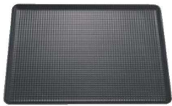
⑤ マトファー/ブウジャ オープン天板(エンボス加工)