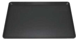
⑧ フッ素加工 ヨーロッパ軽量天板