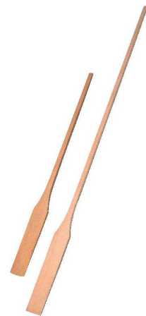
⑦木製テンパンサシ (桎材)

●5枚取・フレンチサイズ(400×600)の天板を収納できます。 ●対角ストッパー付で天板の滑り落ちを防止