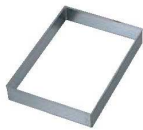
⑥EBM 18-8 角 セルクル 6枚取天板用1/2