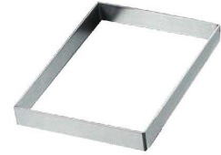
③EBM 18-8 角型 深型 セルクルリング