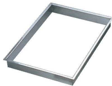
④EBM 18-8 角 セルクル ツバ付 6枚取天板用

*EBM 角セルクルリング37cm、48cmは鉄黒皮製テンパン、アルタイト天板に合う大きさです。 鉄黒皮製テンパン、アルタイト天板はP926をご参照ください。