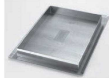
⑥をセットした場合