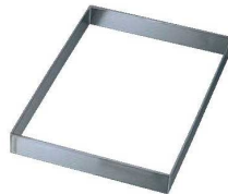
⑤EBM 18-8 角 セルクル 6枚取天板用