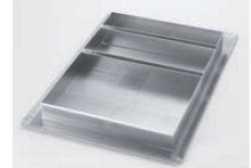
⑦⑧をセットした場合