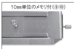
お好みのサイズに拡大縮小できます。