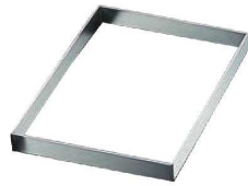
②EBM 18-8 角型 浅型 セルクルリング