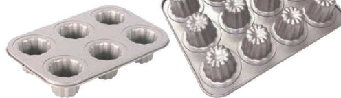
⑧フッ素加工 カヌレ天板