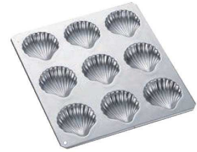
③ギルア マドレーヌ型 コックシェル型 9P No.999