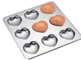
⑤ギルア マドレーヌ型 コックハート型 9P No.994