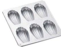
②ギルア マドレーヌ型 マドレーヌシェル型 6P No.987