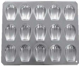
①ギルア マドレーヌ型 マドレーヌシェル型 15ヶ取 No.909