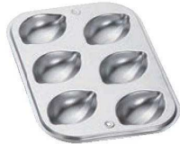
④ギルア マドレーヌ型 レモン型 6P No.918