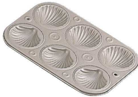
⑦マフィンパンケーキ型 シェル型