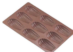
⑫シェル・マドレーヌ型 B-023