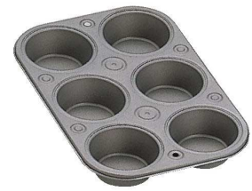
⑨テフロンセレクト マフィンパンケーキ型 6P 57288