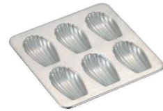
⑥パティシエール 18-8 シェル型 マドレーヌ PP-643