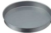
⑦シリコン加工 スポンジ型