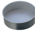
⑤SV ケーキ型 底取