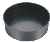
⑧EBM プリキ スーパーコート デコレーション型 共底