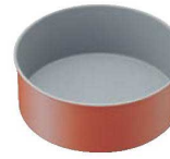
⑪トッピングオレンジ デコレーションケーキ型