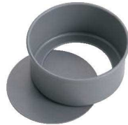
②アルプリント セパトデコ型 底取