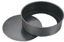
①EBM プリキ スーパーコート デコレーション型 底取