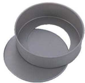
④ベイクウェア フッ素樹脂加工 チーズケーキデコ型 底取