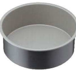
⑨ブラックフィギュア デコレーションケーキ型