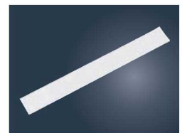
⑮純白デコレシート サイド (1,000枚入)