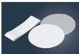
⑫デコレーションケーキ型用敷紙 (30枚入)