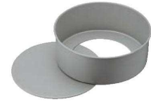
③ベイクウェア フッ素樹脂加工 デコレーション型 底取