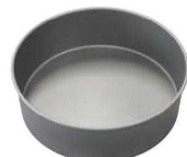
⑩アルプリント デコ型 共底