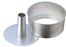
⑥アルスター シフォンケーキ型 底取