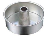
⑨FK プリキ 管付 デコレーション型 共底 18cm