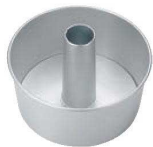
④アルミ シフォンケーキ型 底取