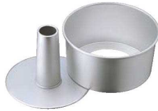
⑤アルミ シフォンケーキ型