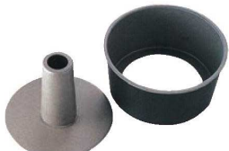
①ブラックフィギュア シフォンケーキ焼型