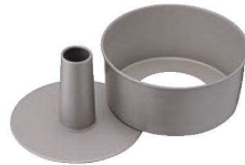
②フッ素樹脂 シフォンケーキ型