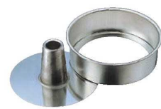
⑧FK プリキ 管付 デコレーション型 底取 15cm

材質:スチール・アルミメッキ 足の高さ:35 ●足が付いているので、おさまりにて冷ます時に安定性があります。