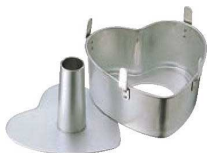
⑦アルスター ハート シフォンケーキ型 底取