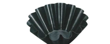
⑭エグゾパン ブリオッシュ 14ウェーブ