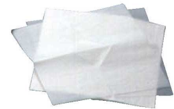
⑯カップケーキ用 数紙 (30枚入) ㊦