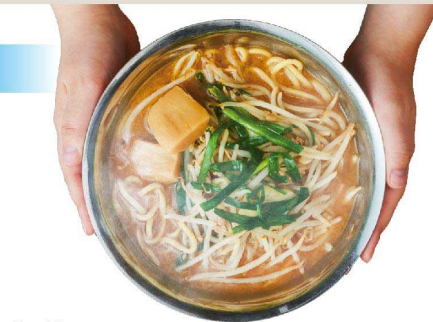
熱さを保つ サーモグラフィによる温度比較(3分後)