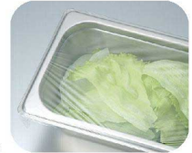
ラップが付きやすくなりました。

深さ25mm・40mmは段なし。 スタッキングの際のはまり込みを防止。 ●はまり込みによる抜き取り作業という無駄な時間は完全解消。 ●段付によるスタッキングの際のはまり込みによる抜き取り作業は完全解消。