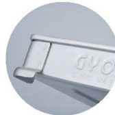
餃子・そばバット足型