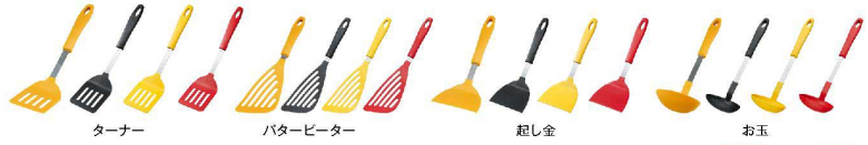
ターナー パターピーター 起し金 お玉

ホットプレートや鍋が傷つきにくい 先端部分にナイロン素材を使用しております。ステンレス製トングと異なり、表面にフッ素加工等が施されたホットプレートや鍋などでも傷が付きにくく、安心してお使いいただけます。 一体成形/1ピース構造 一体成形を行っており、先端部分が柄から抜け落ちることがありません。また隙間もないために洗いがやすく、非常に衛生的です。