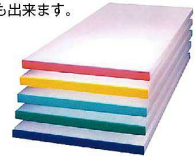
アルファ別注カラーベルトまな板(短辺片辺)