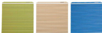
JMK-M G グリーン JMK-M V ベージュ JMK-M B ブルー