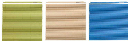
JMK-M G グリーン JMK-M V ベージュ JMK-M B ブルー