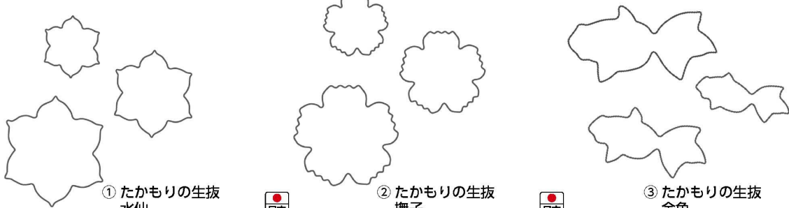
① たかもりの生抜 水仙