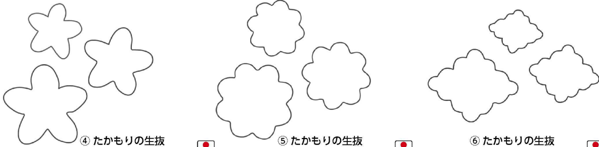
④ たかもりの生抜 ジャズミン