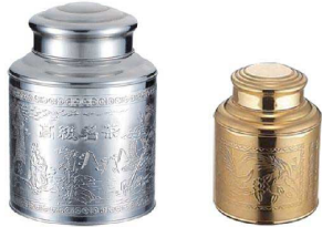
別注:ゴールドメッキ仕上げ