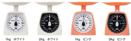
1kg ホワイト 2kg ホワイト 1kg ピンク 2kg ピンク

●受け皿φ165mm 最小目盛1kg:5g 2kg:10g 外幅×奥行×高さmm 165×165×H170