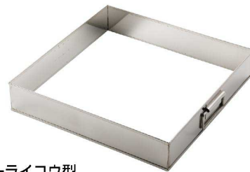
⑧ KD マーライコウ型