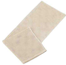
④ KD ムシ布