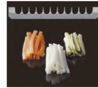
荒目 フライドポテトに