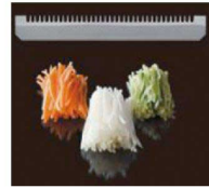
中目 きんぴらごぼうに