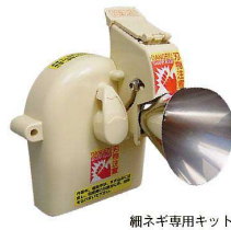
細ネギ専用キット