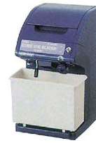
コンパクトタイプ