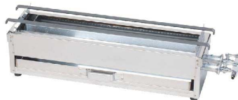
18-0焼鳥コンロガス用2本バーナー