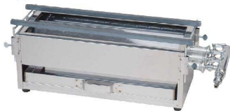
18-0焼鳥コンロガス用3本バーナー