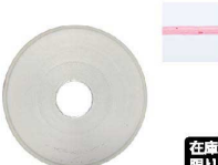
⑫ Ateco口金丸 #7

商品コード 直径×高さ 絞り口最大径 注文コード 標準価格 480017 φ18×H32約φ4.5 07-0414-1201 ¥240