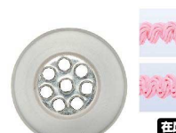
⑱ Ateco口金 モンブラン8穴 #234

商品コード 直径×高さ 絞り口最大径 注文コード 標準価格 480192 φ25×H41約φ11 07-0414-1801 ¥480