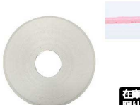
⑬ Ateco口金丸 #8

商品コード 直径×高さ 絞り口最大径 注文コード 標準価格 480018 φ18×H32約φ5 07-0414-1301 ¥240