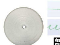
⑥ Ateco口金丸 #261

商品コード 直径×高さ 絞り口最大径 注文コード 標準価格 480139 φ18×H37約φ1.5 07-0414-0601 ¥240