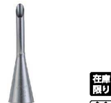
③ Atecoビスマルク口金 #229

商品コード 直径×高さ 絞り口最大径 注文コード 標準価格 480207 φ25×H92約15 07-0414-0301 ¥900