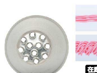
⑲ Ateco口金 モンブラン11穴 #133

商品コード 直径×高さ 絞り口最大径 注文コード 標準価格 480143 φ18×H27約φ10 07-0414-1901 ¥360