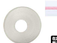
⑭ Ateco口金丸 #9

商品コード 直径×高さ 絞り口最大径 注文コード 標準価格 480019 φ18×H30約φ6 07-0414-1401 ¥240