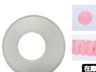
⑰ Ateco口金丸 #12

商品コード 直径×高さ 絞り口最大径 注文コード 標準価格 480022 φ18×H28約φ8 07-0414-1701 ¥240