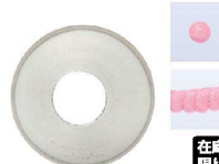
⑮ Ateco口金丸 #10

商品コード 直径×高さ 絞り口最大径 注文コード 標準価格 480020 φ18×H29約φ7 07-0414-1501 ¥240