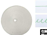
⑤ Ateco口金丸 #00

商品コード 直径×高さ 絞り口最大径 注文コード 標準価格 480138 φ18×H36約φ1.5 07-0414-0501 ¥240