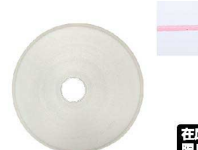
⑩ Ateco口金丸 #5

商品コード 直径×高さ 絞り口最大径 注文コード 標準価格 480015 φ18×H33約φ3.5 07-0414-1001 ¥240