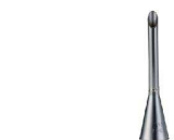
② Atecoビスマルク口金 #230

商品コード 直径×高さ 絞り口最大径 注文コード 標準価格 480208 φ18×H77約10 07-0414-0201 ¥900