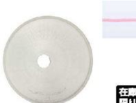
⑨ Ateco口金丸 #4

商品コード 直径×高さ 絞り口最大径 注文コード 標準価格 480014 φ18×H33約φ3 07-0414-0901 ¥240