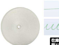
④ Ateco口金丸 #000

商品コード 直径×高さ 絞り口最大径 注文コード 標準価格 480137 φ18×H36約φ1 07-0414-0401 ¥240