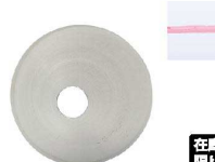
⑪ Ateco口金丸 #6

商品コード 直径×高さ 絞り口最大径 注文コード 標準価格 480016 φ18×H33約φ4 07-0414-1101 ¥240