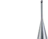
① Atecoビスマルク口金 #231

商品コード 直径×高さ 絞り口最大径 注文コード 標準価格 480208 φ25×H90約8 07-0414-0101 ¥950