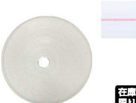
⑧ Ateco口金丸 #3

商品コード 直径×高さ 絞り口最大径 注文コード 標準価格 480014 φ18×H33約φ2 07-0414-0801 ¥240