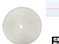
⑦ Ateco口金丸 #1

商品コード 直径×高さ 絞り口最大径 注文コード 標準価格 480011 φ18×H35約φ1.5 07-0414-0701 ¥240