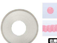
⑯ Ateco口金丸 #11

商品コード 直径×高さ 絞り口最大径 注文コード 標準価格 480021 φ18×H27約φ7 07-0414-1601 ¥240