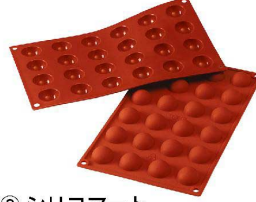
② シリコマート 半球30 24取