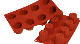
⑥ シリコマート ビックキューブ8取