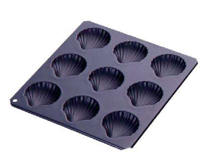
⑪ TCBlack マドレーヌ シェル型 9P G