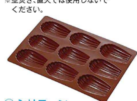
⑬ シリコン ラバーパン