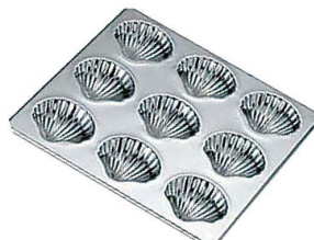
⑨ TCプロシェル型 9P G