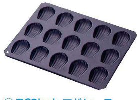
⑫ TCBlack マドレーヌ シェル型 15P G