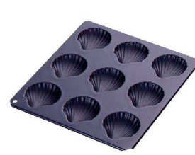
⑪ TCBlack マドレーヌ シェル型 9P G