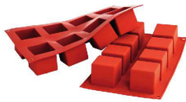
④ シリコマート キューブ8取