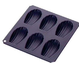
⑩ TCBlack マドレーヌ シェル型 6P G