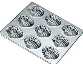
⑨ TCプロシェル型 9P G