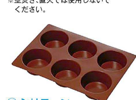
⑮ シリコン ラバーパン