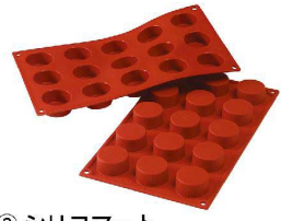
③ シリコマート プチフルール15取