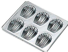
⑧ TCマドレーヌ シェル型 6P G