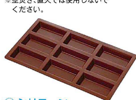
⑭ シリコン ラバーパン