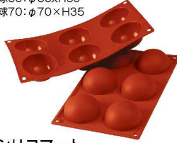
① シリコマート 半球6取