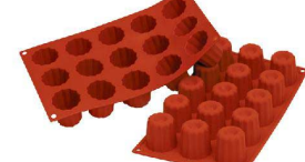
⑦ シリコマート ミディアムキューブ15取