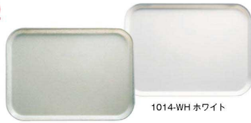
1014 アンチークパーチメント