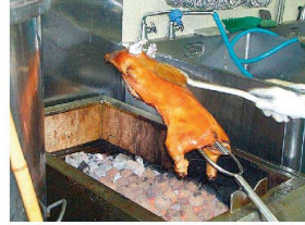
② 仔豚フォーク 中国