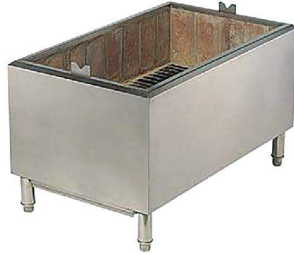
① 仔豚焼コンロ 炭用 H 納運 中国