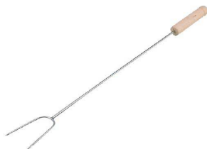
⑩ 木柄 肉さし 2本針 中国