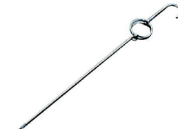
⑧ 金銭鶏針 中国