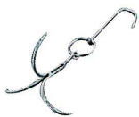
⑥ 三ツ星フック 中国