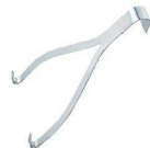
⑦ 焼豚用ハンガー 中国