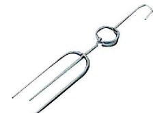
⑨ 乳鴿フック 中国