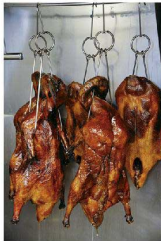
③ 北京ダックフック 中国