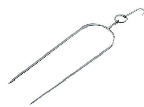
⑫ 琵琶鴨用フォーク 中国