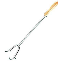
③ 木柄ロングフック 2本爪