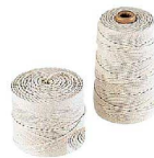
⑪ KD 料理糸