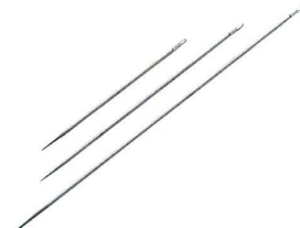
⑧ ST チキン針