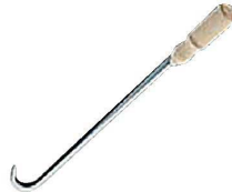
② 木柄ロングフック