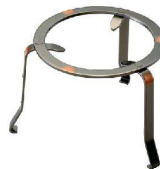
⑪ 鉄五徳(ブロンズ風)