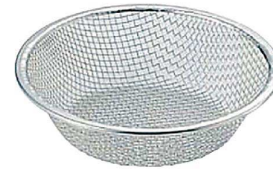
⑥ ステンレス紙鍋ホルダー浅型