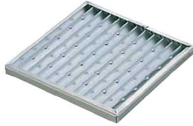
① KD 卓上焼台(鉄crアミ付) 16cm