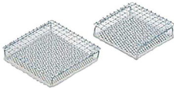
③ セラミック板ステンレス網