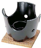
⑩ KD アルミコンロセット