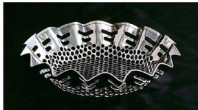
⑦ 18-8鋼ホルダー S-100

紙鍋全周をピッタリホールドする事により、紙鍋と受け網との間にすき間がなく、紙鍋の後ろにかべをつくる事によって、より一層破れにくくなっています。