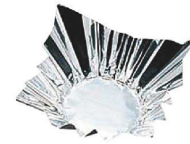
⑨ アルミ箔紙鍋 シルバー(100枚入)