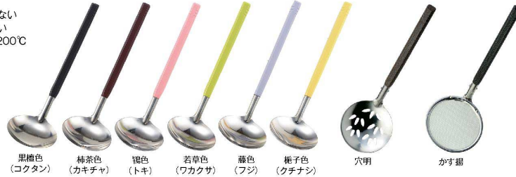
黒檀色 (コクタン) 柿茶色 (カキチャ) 錆色 (トキ) 若草色 (ワカグサ) 藤色 (フジ) 梶子色 (クチナシ) 穴明 かす揚