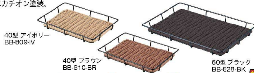
40型 アイボリー BB-809-IV