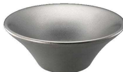
④ VINTAGEメタル丼 フラワー 厚口タイプ C