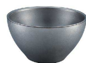
⑧ VINTAGEメタル丼 ミーニ C