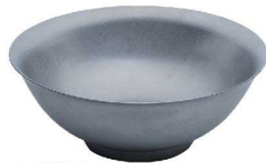
① VINTAGEメタル丼 C