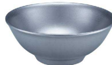
② VINTAGEメタル丼 厚口タイプ C