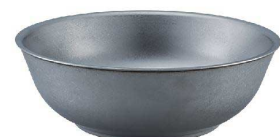
⑤ VINTAGEメタル丼 ハッチ C