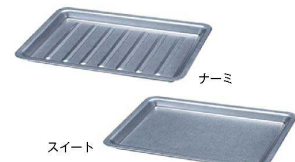
⑪ VINTAGEメタル丼トレー C