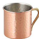
⑭ 銅ニュースペシャルマグC