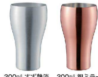
⑱ 華タンブラー B