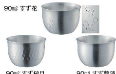
⑯ 華ぐいのみ B