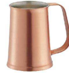
③ SW銅フィリックスビールジョッキ