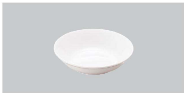
⑧ 燕舞ボーンチャイナ マスタード皿 C 在庫限り 燕舞 中国 商品コード 規格 直径×高さmm 注文コード 標準価格 472037 φ75×H18 φ75×H18 07-0059-0801 ¥700 材質/ファインボーンチャイナ