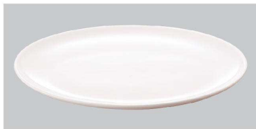
④ 燕舞ボーンチャイナ オーバルプレート C 在庫限り 燕舞 中国 商品コード 規格 縦×横×高さmm 注文コード 標準価格 472039 10インチ 254×188×H24 07-0059-0401 ¥4,500 472040 12インチ 290×220×H30 07-0059-0402 ¥6,800 材質/ファインボーンチャイナ