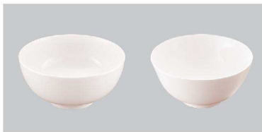
⑥ 燕舞ボーンチャイナ ラウンドボウル C 在庫限り 燕舞 中国 商品コード 規格 幅×全長mm 注文コード 標準価格 472059 15cm 150×H73 07-0059-0601 ¥1,300 472033 7インチ φ178×H67×(1230) 07-0059-0602 ¥2,300 材質/ファインボーンチャイナ