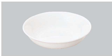
⑨ 燕舞ボーンチャイナ ベリー皿 C 在庫限り 燕舞 中国 商品コード 規格 直径×高さmm 注文コード 標準価格 472056 φ139×H35 φ139×H35 07-0059-0901 ¥1,500 材質/ファインボーンチャイナ