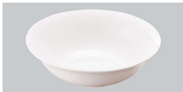
⑦ 燕舞ボーンチャイナ クープボウル C 在庫限り 燕舞 中国 商品コード 規格 直径×高さmm×(容量cc) 注文コード 標準価格 472012 9インチ φ226×H64×(1300) 07-0059-0701 ¥2,600 472034 8 1/2インチ φ239×H67×(1485) 07-0059-0702 ¥3,000 材質/ファインボーンチャイナ