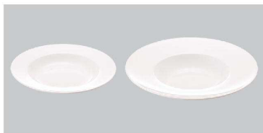
① 燕舞ボーンチャイナ マフィン&スープ皿 C 在庫限り 燕舞 中国 商品コード 規格 直径×高さmm×(容量cc) 注文コード 標準価格 472011 7インチ φ177×H31×(100) 07-0059-0101 ¥1,260 472010 8インチ φ205×H33×(120) 07-0059-0102 ¥1,380 472009 9インチ φ231×H41×(260) 07-0059-0103 ¥2,000 472036 10インチ φ255×H39×(365) 07-0059-0104 ¥3,800 472035 12インチ φ308×H55×(560) 07-0059-0105 ¥6,500 材質/ファインボーンチャイナ