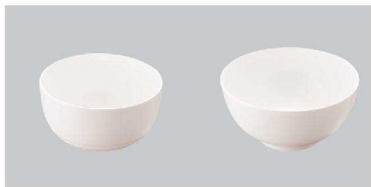
⑤ 燕舞ボーンチャイナ ライスボウル C 在庫限り 燕舞 中国 商品コード 規格 直径×高さmm×(容量cc) 注文コード 標準価格 472016 11cm φ112×H55×(280) 07-0059-0501 ¥880 472015 13cm φ127×H60×(470) 07-0059-0502 ¥970 材質/ファインボーンチャイナ