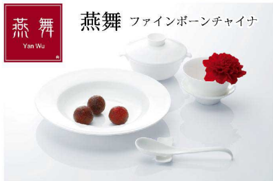
燕舞 ファインボーンチャイナ

日本の中国料理にマッチする カンダが提案するファインボーンチャイナです。 ボーンチャイナなのにリーズナブルな商品です。 美しい光沢が料理を演出してくれます。