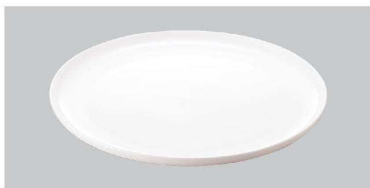
③ 燕舞ボーンチャイナ 丸クープ皿 C 在庫限り 燕舞 中国 商品コード 規格 直径×高さmm 注文コード 標準価格 472006 8インチ φ202×H24 07-0059-0301 ¥1,600 472005 9インチ φ232×H29 07-0059-0302 ¥1,800 472032 10インチ φ253×H23 07-0059-0303 ¥3,800 472031 12インチ φ307×H27 07-0059-0304 ¥5,800 材質/ファインボーンチャイナ